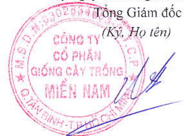
Hàng Phi Quang