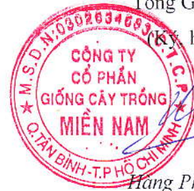
Hàng Phi Quang