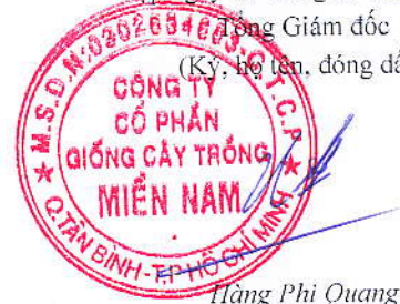
Hàng Phi Quang